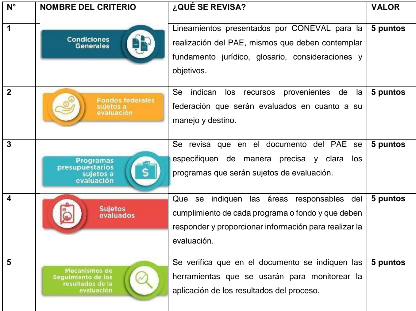
Tabla 17. Criterios para el IIEPM 2024.

Para esta edición se considerarán 12 criterios, derivados de la normatividad vigente que regula la integración y ejecución del Programa Anual de Evaluación Municipal 2023.